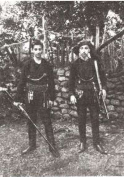
Her'in Lazistan'daki kolonisi Adıralı (Pazar) Tiberopolis Fesli Elinin oğulları, yemsel kuyularını ve sifirlerini.

“Aralarından pek azı bizi gâvur diye adlandırmaktan uzak durdu.”